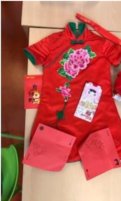
Chinese New Year