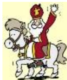
Sinterklaas in het land