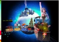
Toms Magische Speelgoedwinkel