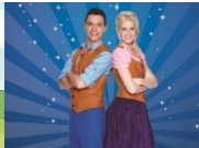
Hans & Grietje