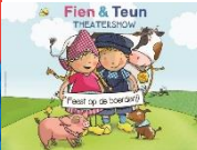
Fien & Teun