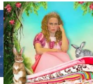
Prinses op de Erwt